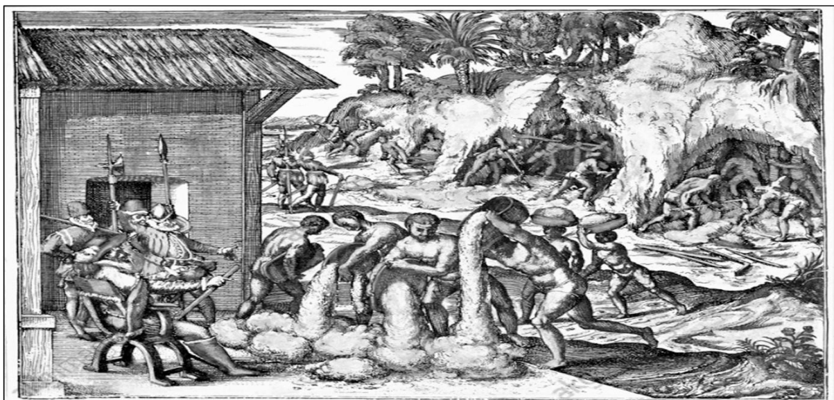
Σκλάβοι από την Αφρική εργάζονται σε ορυχεία χρυσού στην ισπανική αποικία του Αγίου Δομήνικου (Γκραβούρα του Theodor de Bry, 1595)